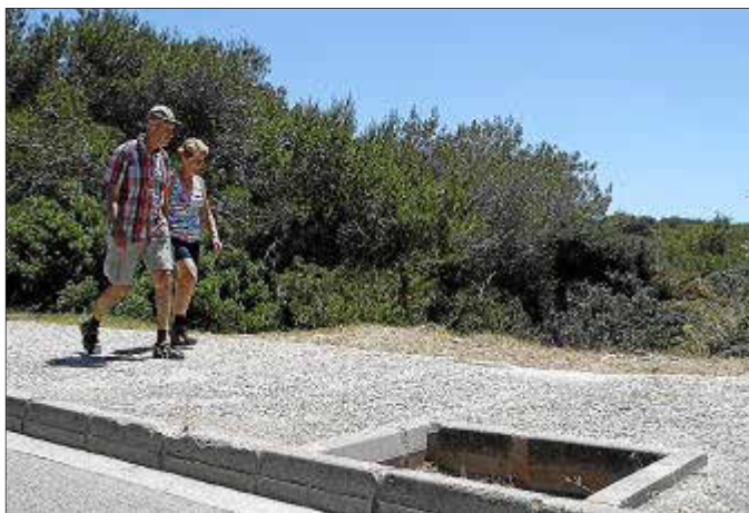
Dos turistas pasean por una acera sin baldosas ni arbolado en la urbanización de Cala Blanca.

▶ La encuesta de PIME detecta una mejoría en la limpieza de las playas, pero empeora el vallado de solares y faltan aparcamientos