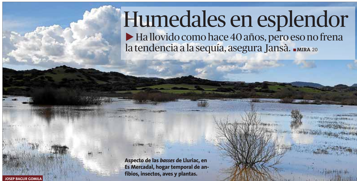
Aspecto de las basses de Lluriac, en Es Mercadal, hogar temporal de anfibios, insectos, aves y plantas.

► Ha llovido como hace 40 años, pero eso no frena la tendencia a la sequía, asegura Jansà. ■ MIRA 20