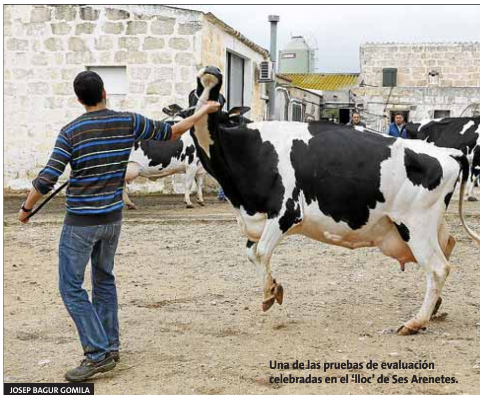
Una de las pruebas de evaluación celebradas en el 'lloc' de Ses Arenetes.