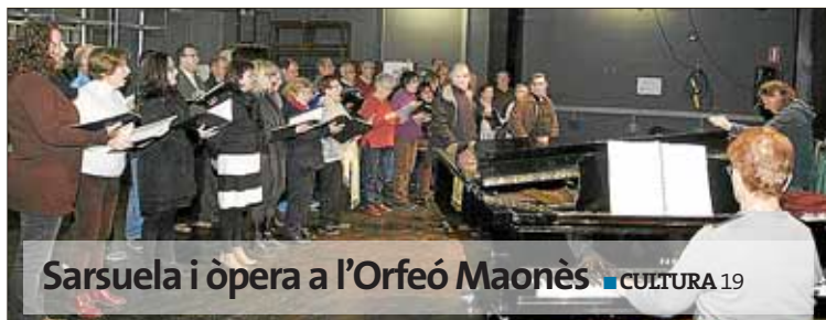
Sarsuela i òpera a l'Orfeo Maonès ■ CULTURA 19