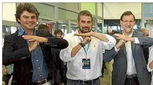
El presidente Rajoy hace el gesto del dolmen de Antequera.

El Consell analiza la campaña coincidente impulsada por el municipio de Málaga, que también opta a ser declarado Patrimonio Mundial por la UNESCO, un año antes que Menorca. ■ CULTURA 21