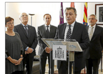
Acto celebrado ayer en Maó.

ASHOME considera positivas las facilidades que da para la modernización de las zonas turísticas. ■ LOCAL 7