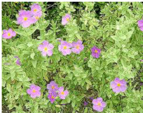
Cistus albidus i Cistus salviifolius. Dalt, estepa blanca, arbust autòcton de creixement ràpid, floració vistosa i que estabiliza terres, a l'igual que l'estepa borrera (baix a la dreta). Enmig, mata (Pistacia lentiscus).

res, aquelles que tenen la capacitat d'estabilitzar les terres alterades, moltes les mal anomenam «males herbes». També són pioneres espècies com el càrritx, les estepes, l'enclova i molts de trèvols. Una vegada hagin passat uns 3 a 5 anys, aquella terra haurà arribat a una certa estabilitat, després, hi podran créixer bé plantes que viuen més temps com mata, aladern, alzina o d'altres exòtiques com hibiscos o una buguenvílea. És el que coneixem com a vegetació d'estructura, la que és més persistent, resilient, dona