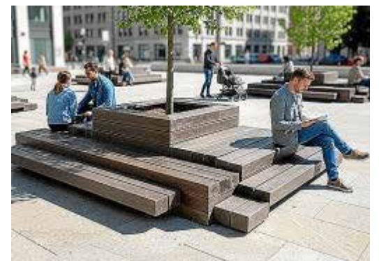
Bancos modulares con jardinera central.

diseña y fabrica mobiliario para parques infantiles, bancos, tumbonas, jardineras, parterres, conjuntos de jardín, aparca bicicletas, paradas de autobús, pérgolas, camas balinesas, casetas, baúles para herramientas, vallas, así como puertas correderas para vehículos con acceso peatonal integrado. Este mobiliario cuenta con una vida útil superior a los 50 años, de ahí que sea una opción ideal para espacios exteriores. Los trabajos se realizan a medida y son personalizables. Como novedad, Export Directe ha lanzado una línea de bancos modulares con jardinera central, ideales para crear espacios de encuentro y descanso al aire libre.