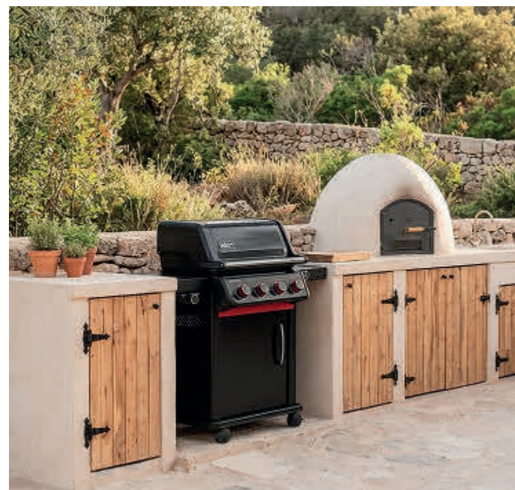
Barbacoa. Apalliser destaca esta temporada la nueva barbacoa Weber Spirit EPX-435R en edición Stealth, un diseño completamente en negro, limpio, potente y elegante. Cocinar al aire libre ya no es algo puntual, sino una experiencia en sí misma.