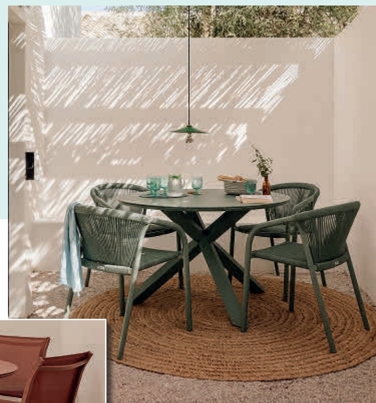
El mobiliario exterior llega en tonos arcilla, caoba y laurel que aportan calidez y encajan perfectamente con la arquitectura isleña.

completamente en negro, limpio, potente y elegante porque cocinar al aire libre ya no es algo puntual, sino una experiencia en sí misma que lo convierte en una experiencia compartida con amigos y familia. Pero más allá de la estética, Weber sigue siendo la marca número uno en la que Apalliser confía desde hace muchos años porque el resultado es siempre óptimo. Por ello, como distribuidores oficiales de la marca, cuen-