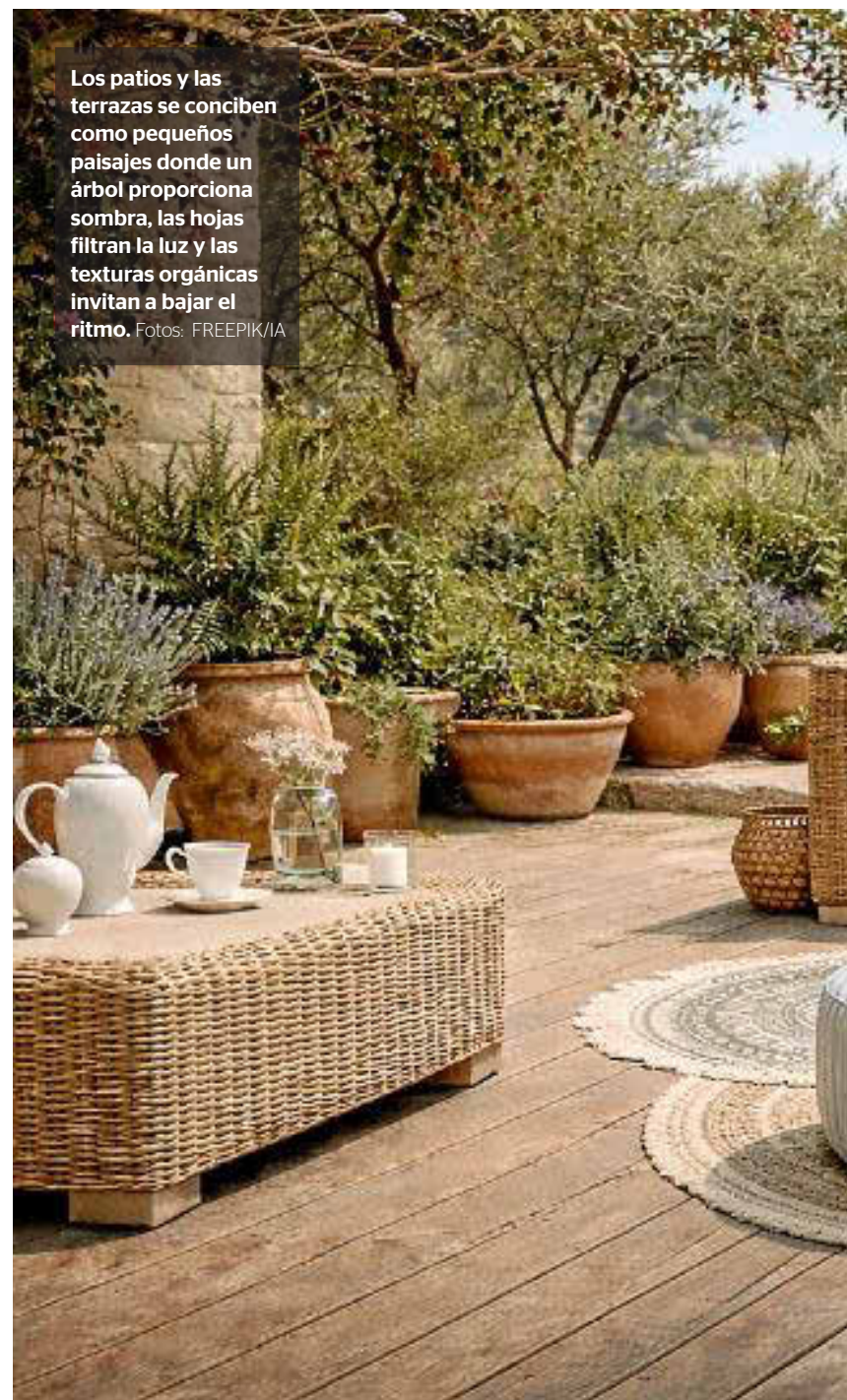
Los patios y las terrazas se conciben como pequeños paisajes donde un árbol proporciona sombra, las hojas filtran la luz y las texturas orgánicas invitan a bajar el ritmo.

TENDENCIAS El gran protagonista de la temporada es el diseño biofílico: árboles integrados, muros verdes y macetas XL