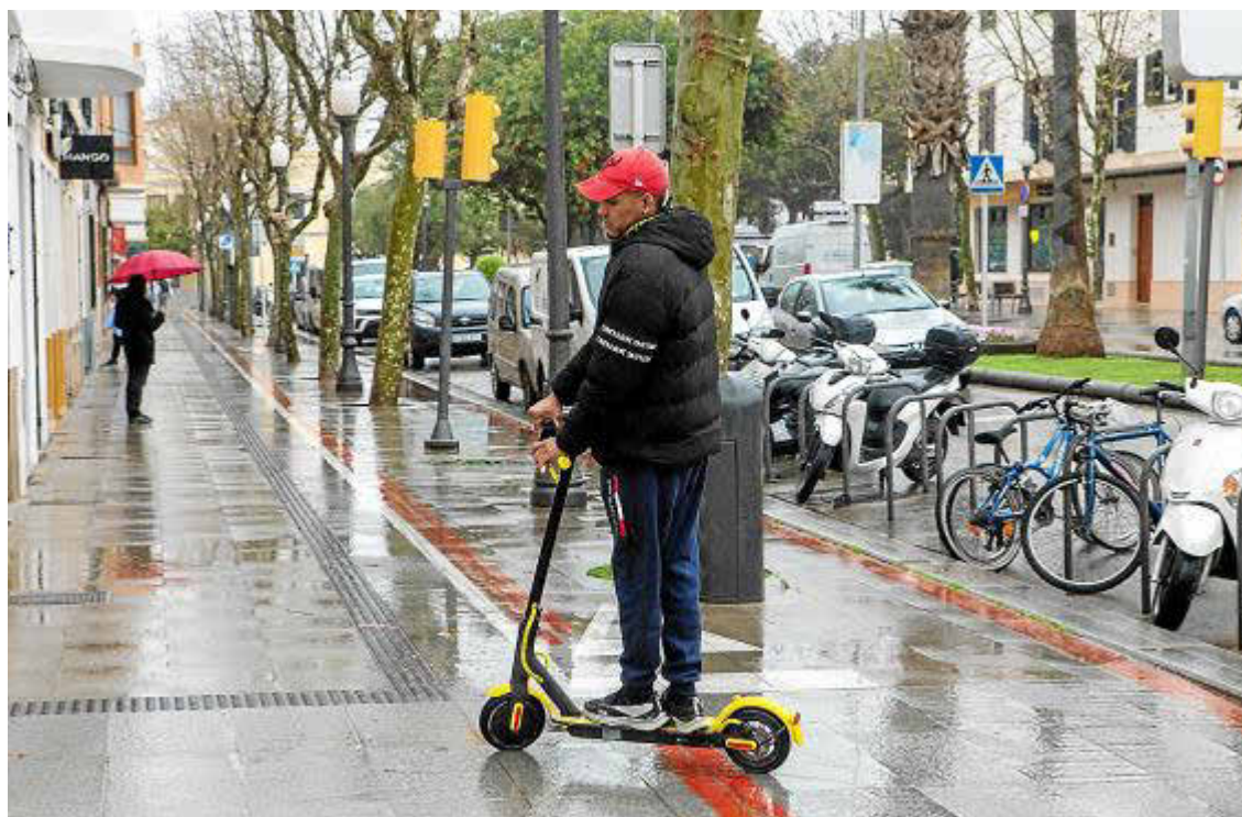
Los VMP deben estar inscritos en el registro, disponer de una etiqueta identificativa y tener seguro.

Según señala Díaz, únicamente queda pendiente de definir el uso obligatorio del casco, una decisión que previsiblemente se adoptará en unas pocas semanas. Hasta el momento, rige la normativa municipal.